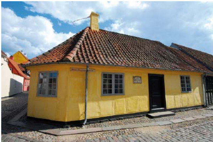
▲ Dom dzieciństwa Hansa Ch. Andersena

listopada 2017 r. jest zamknięte. Jest to spowodowane budową nowej placówki, której projektantem został słynny japoński architekt Kengo Kuma. Co ciekawe, \frac{2}{3} nowego muzeum ma znaleźć się pod ziemią, a na 5600 m 2 powstanie baśniowy świat znany z twórczości Andersena. Ogromne przedsięwzięcie, którego koszt wyniesie ponad 300 mln koron, ma zostać zakończone w 2020 r. Tymczasowo kolekcję poświęconą pisarzowi umieszczono w budynku przy Claus Bergs Gade 11, czyli w siedzibie Muzeum Carla Nielsena 📍 Carl Nielsens Museum; V–IX wt.–nd. 11.00–15.00; wstęp 30 kor., do 17 lat bezpłatnie; http://museum.odense.dk/carl-nielsensemuseet poświęconego najslynniejszemu duńskiemu kompozytorowi. Prezentowane są w nim również rzeźby jego żony Anne-Marie Carl-Nielsen. Drugie muzeum artysty urządzone w jego domu rodzinnym w Årslev, w posiadłości, w której mieszkał do 1879 r.