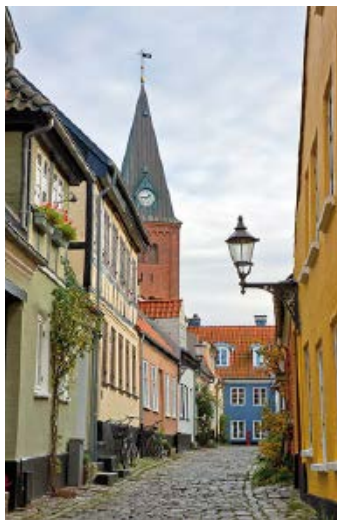
▲ Uliczka w Aalborgu

40 kor.; http://en.springeren-maritimt.dk . Główną atrakcją muzeum jest w pełni sprawna łódź podwodna „Springeren”, od której nazwę otrzymało to miejsce. Zwiezczać możemy także m.in. torpedowiec