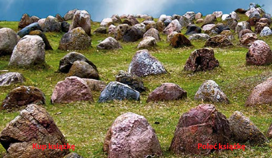
▼ Lindholm Høje

Kilka kilometrów na północ od centrum Aalborga, w dzielnicy Nørresundby, znajduje się jedno z największych znalezisk wikingich w Skandynawii, ★ cmentarzysko Lindholm Høje . Chowano na nim wozów z całym rynsztunkiem, ich łodzie zakopywano w ziemi z ożaglowaniem i kotwicami. Pomniejsi musieli zadowolić się samym symbolem łodzi, których zarysy tworzyły wbite w ziemię kamienie. Nekropolia z ok. 150 pochówkami należała do osady o nazwie Vendila, która zapewne przegrała rywalizację z nowym osiedlem powstającym w miejscu dzisiejszego Aalborga. Odkryto tu też ślady około tuzina domostw. Wystawa w mieszczącym się obok Muzeum Lindholm Høje 📍 IV–X wt.–nd. 10.00–17.00, XI–III 10.00–16.00; wstęp 75 kor., do 18 lat bezpłatnie objaśnia znaleziska za pośrednictwem makiet i rysunków. Ze śródmieścia Aalborga dojedziemy tu autobusem nr 2.