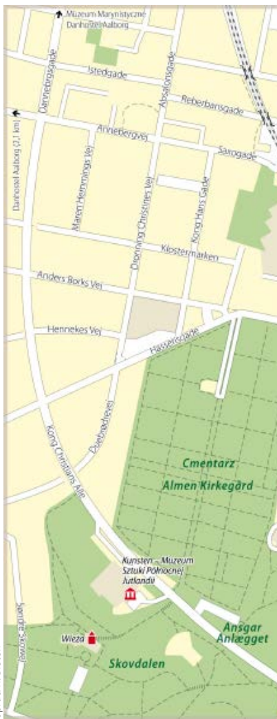
oprac. R. Bletek

kłopotów rozpoznają turyści będący wcześniej w Finlandii. Białe bryły w zieleni zaprojektował Alvar Aalto. Gmach mieści zbiory Muzeum Sztuki Północnej Jutlandii 📍 Nordjyllands kunstmuseum; wt., czw.–nd. 10.00–17.00, śr. 10.00–21.00; wstęp 95 kor., do 18 lat bezpłatnie, gromadzące ok. 1,5 tys. prac malarskich